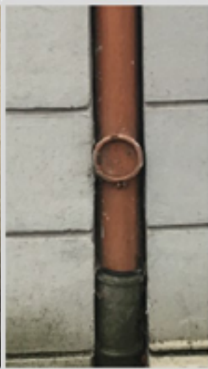
FL mit Revisionsöffnung