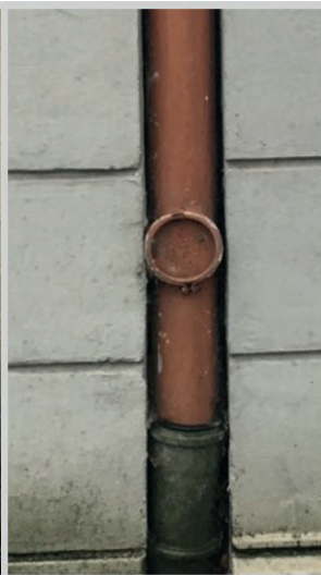
FL mit Revisionsöffnung